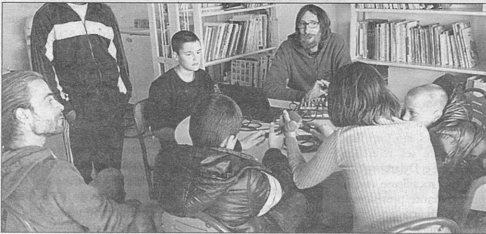
A l'IMPro de La Roseraie à La Souterraine, les adolescents ont travaillé sur la musique.

Du reportage au montage en passant par la technique, des adolescents accueillis au sein de l'IMPro de la Roseraie de La Souterraine, de l'association Guéret Variétés et du centre de loisirs CIGALE en partenariat avec Quartier rouge de Felletin, se sont essayés pendant quelques jours à la radio. Une émission en direct sera enregistrée le 4 mai au Centre médical de Sainte-Feyre.