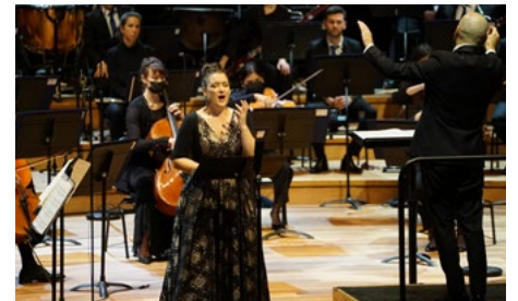
Il fait novembre en mon âme , Bechara El Khoury, 2020

Composer un concert-hommage aux victimes des attentats du 13 novembre 2015, en réponse à la demande des parents de Stéphane, décédé lors de l'attentat du Bataclan.